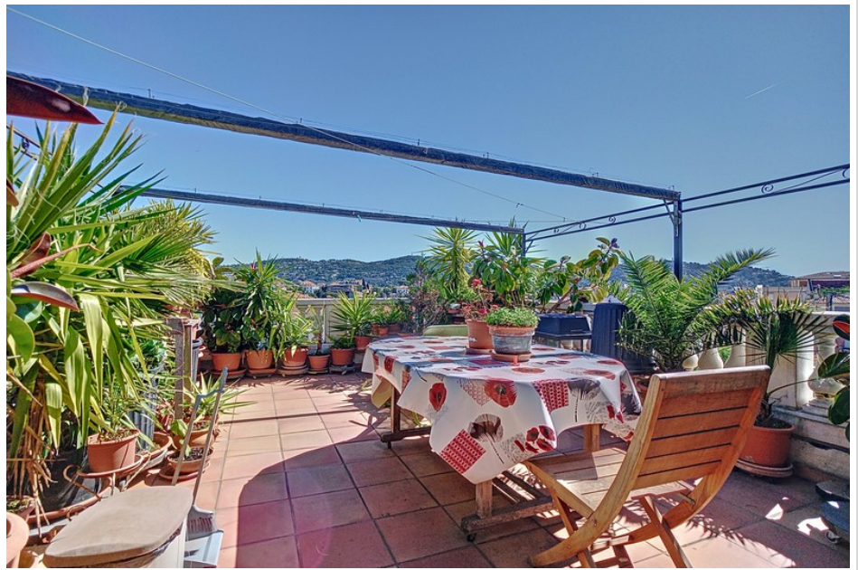
Maison de ville 6058 Cannes